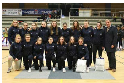
Pôle Occitanie #8