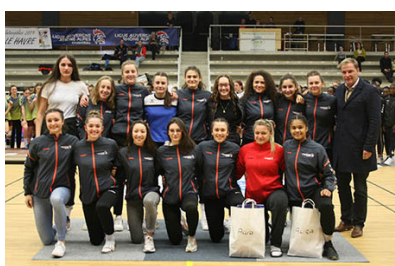
Pôle Auvergne Rhône Alpes #5