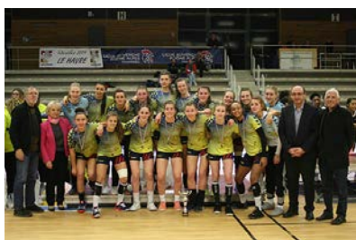
Pôle Bourgogne Franche-Comté #2