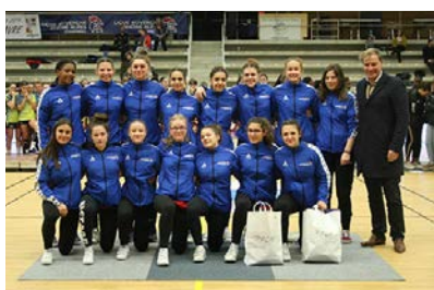
Pôle Provence Alpes Côte d'Azur Corse #7