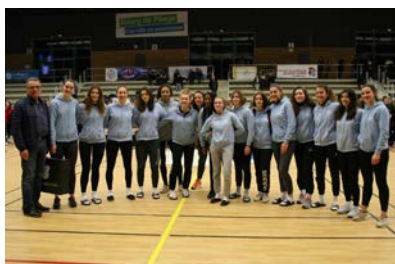
Pôle Nouvelle Aquitaine #8