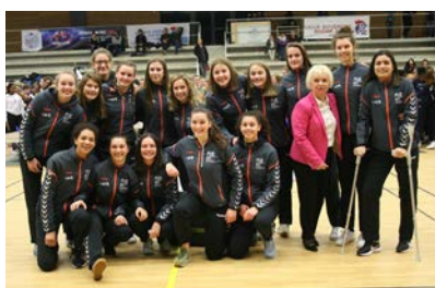
Pôle Normandie #13