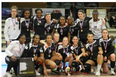
Pôle Centre Val de Loire #2