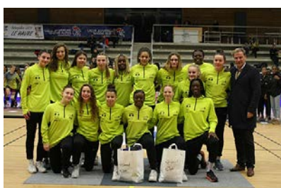
Pôle Grand Est #4