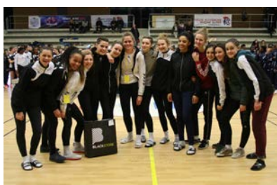
Pôle Pays de la Loire #14