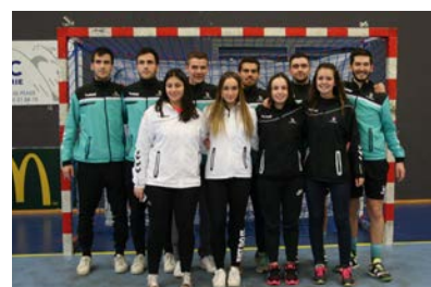
Les Arbitres Jeunes