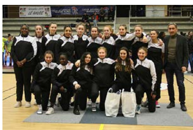
Pôle Pays de la Loire #14