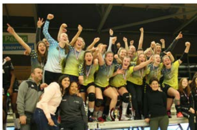
Pôle Bourgogne Franche-Comté #1