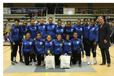
Pôle Antilles/Guyane #9