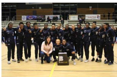
Pôle Île-de-France #4