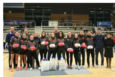
Les Arbitres Jeunes