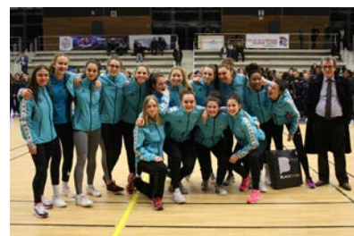
Pôle Provence Alpes Côte d'Azur Corse #9