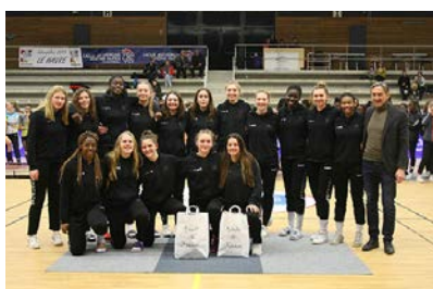
Pôle Hauts-de-France #10