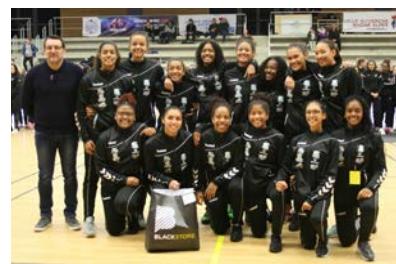
Pôle Réunion #12