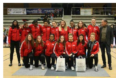
Pôle Nouvelle Aquitaine #12