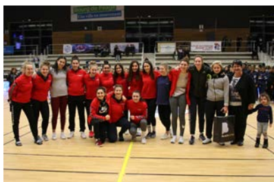
Pôle Auvergne Rhône Alpes #7