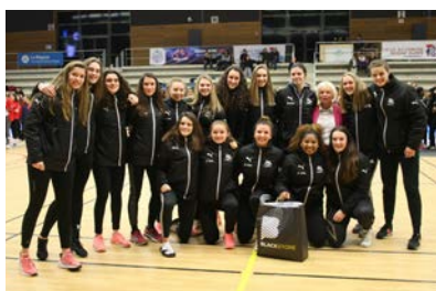
Pôle Bretagne #5