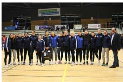
Pôle Occitanie #10