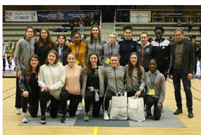
Pôle Normandie #11