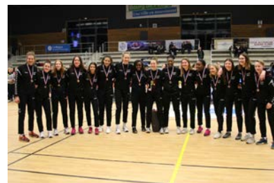
Pôle Grand Est #3