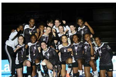
Pôle Centre Val de Loire #1