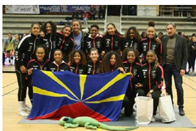
Pôle Réunion #13