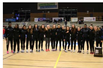
Pôle Hauts-de-France #6