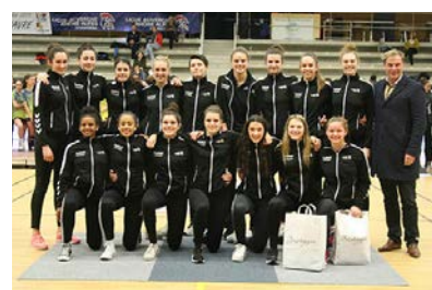
Pôle Bretagne #6