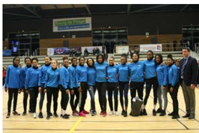
Pôle Antilles / Guyane #11