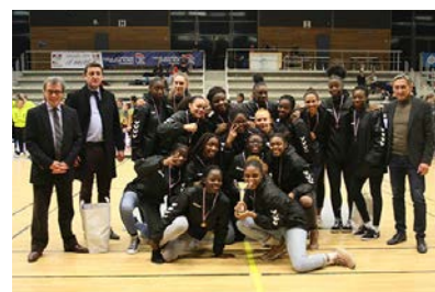
Pôle Île-de-France #3