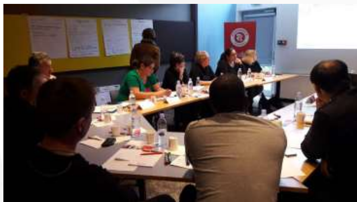
Atelier participants zone rurale