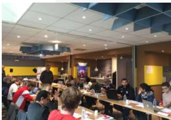
Atelier participants quartier politique de la ville